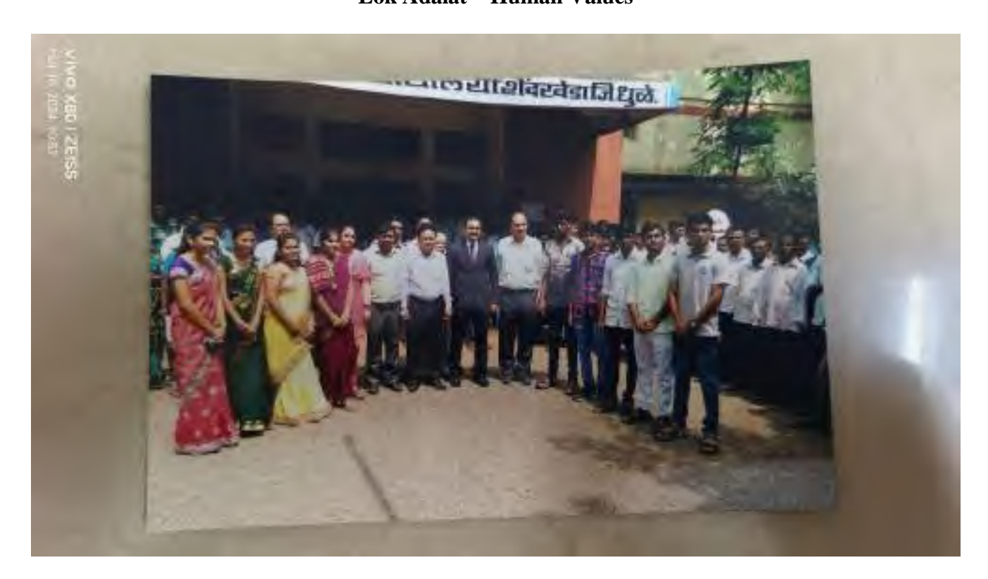
Aids Awareness – Human Values