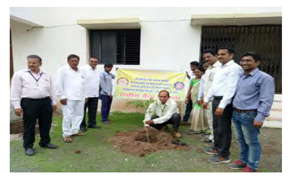
Tree plantation 07/07/2018