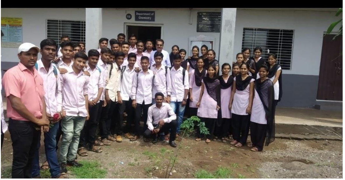
Department of chemistry organised Campus interview 21 students selected