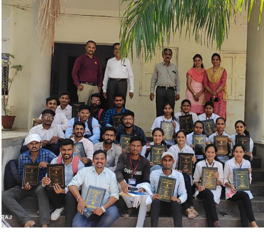
Valedictory Function T. B. Sc. Students 2018-19 Batch